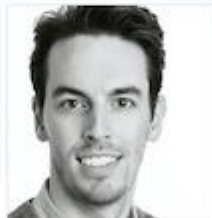
Frederik Friederichs Light Bureau Norway